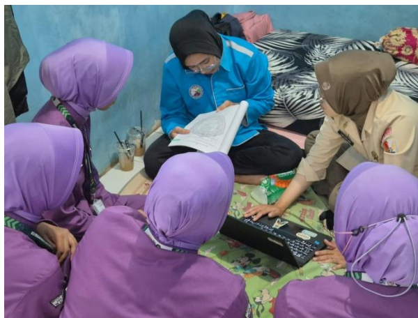
Gambar 4. Kegiatan Pemeriksaan dan Evaluasi

Pada tahap Check , pemantauan penerapan SOP menunjukkan perbaikan keteraturan alur kerja petugas saat terjadi gangguan sistem. Petugas menjadi lebih terarah, pelayanan tetap berjalan tanpa kebingungan, dan pencatatan data lebih konsisten serta mudah ditelusuri. Namun, masih diperlukan penyesuaian, terutama pada proses input ulang data setelah sistem normal, sebagai bahan evaluasi untuk penyempurnaan SOP agar lebih sesuai dengan kondisi pelayanan.