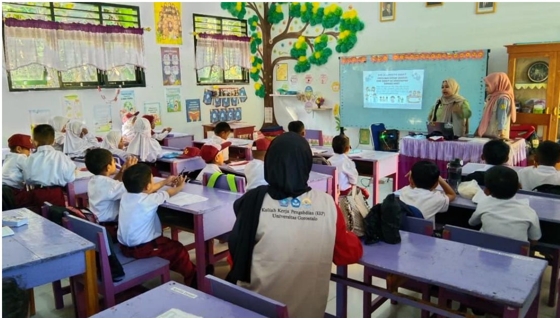
Gambar 2. Pemberian Materi dan Observasi Perubahan Sikap Siswa terkait PHBS

Hasil observasi menunjukkan bahwa sebagian besar siswa menunjukkan perubahan sikap positif. Pada awal kegiatan, hanya sekitar 45% siswa yang tampak aktif bertanya atau menjawab pertanyaan. Namun, pada sesi kedua dan ketiga, jumlah siswa yang aktif meningkat menjadi 72%. Pada sesi terakhir, lebih dari 80% siswa terlibat aktif dalam diskusi maupun simulasi.