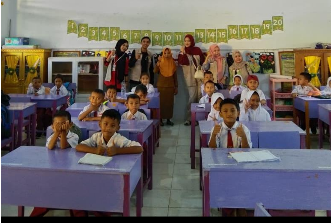
Gambar 3. Sosialisasi Stop Bullying